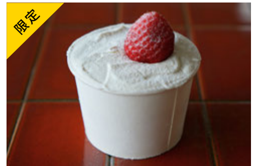
苺のカップショートケーキ ¥1500 (テイクアウトver)