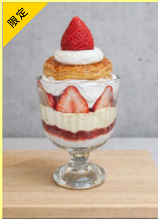
とちあいかの 苺ミルフィーユパフェ ¥2300