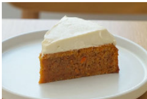
キャロットケーキ ¥820