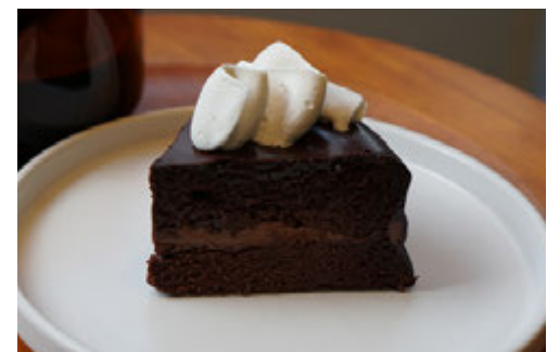
濃厚ショコラケーキ ¥850 (グルテンフリー)