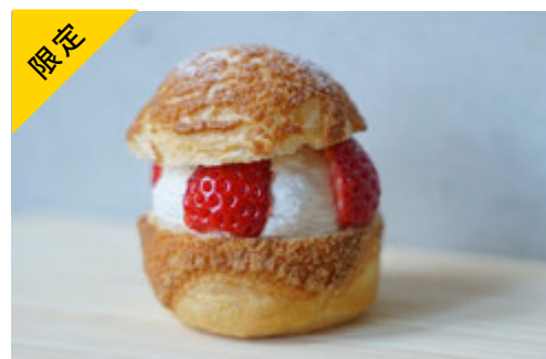
苺のシュークリーム ¥680