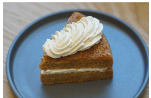
キャロピーケーキ ¥780 (キャロットケーキ×ピーナッツ)