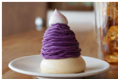
紅芋モンブラン ¥770 (グルテンフリー)