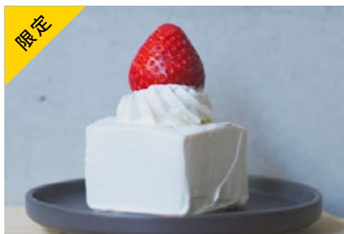
苺のショートケーキ ¥1500 (イートイン限定)